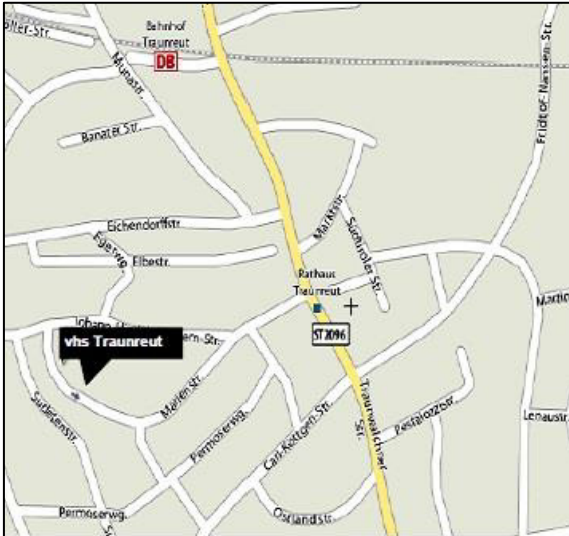
Lageplan der vhs Traunreut e. V.